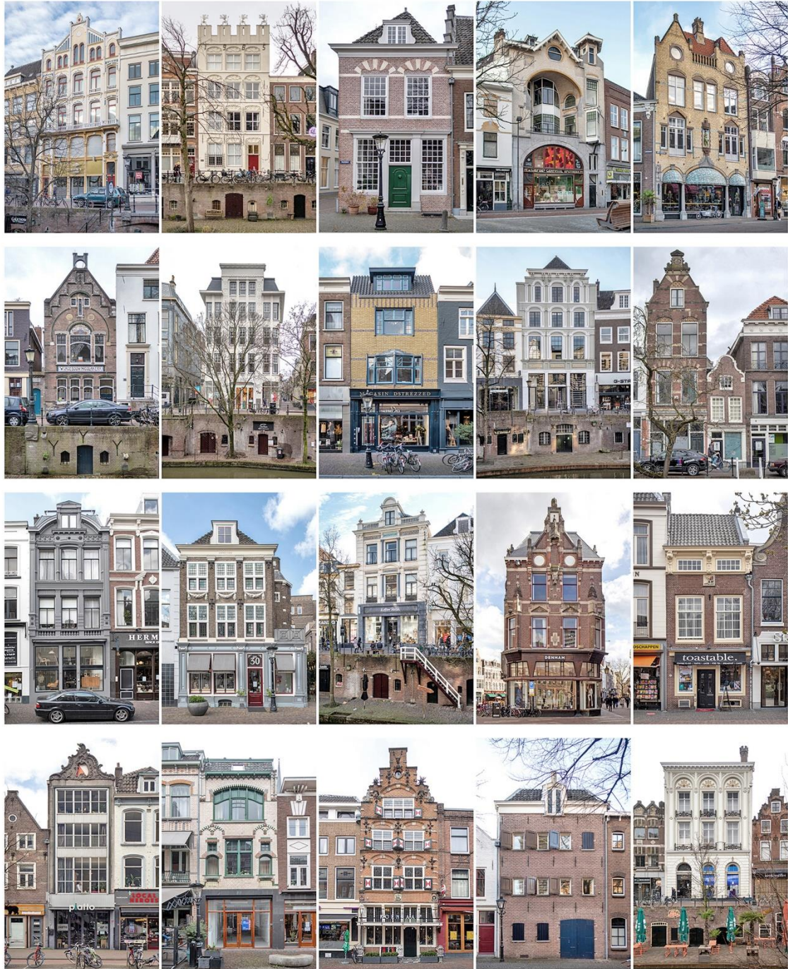
UTRECHTSE TOPGEVELS 2021 voor poster (42 x 60cm) zie www.tonverweij.nl